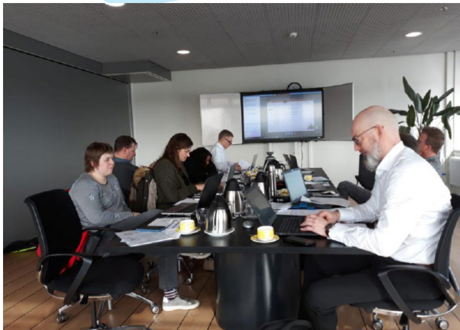
La réunion virtuelle du consortium en mars de cette année au STC Group

Je suis très heureux que, malgré l'impact du corona, nous ayons tous continué à travailler de manière productive pour atteindre les objectifs qui faciliteront la mise en œuvre de la directive européenne 2017/2397. Continuez à faire du bon travail !